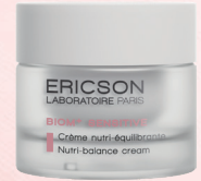
舒敏抗炎滋養霜 NUTRI-BALANCE CREAM E1183 / 50ml

質感輕盈，蘊含菸鹼醯胺和人參萃取。集舒緩、抗氧化和保濕三效合一，能促進肌膚微生物群平衡。