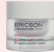
舒敏抗炎水嫩霜 HYDRA-COMFORT CREAM E1182 / 50ml

質感清爽不黏膩。結合經乳酸桿菌發酵的米漿濾液和生物脂質複合物的雙重濃縮精華，具強效舒敏的功效，增強皮膚屏障，舒緩皮膚敏感。